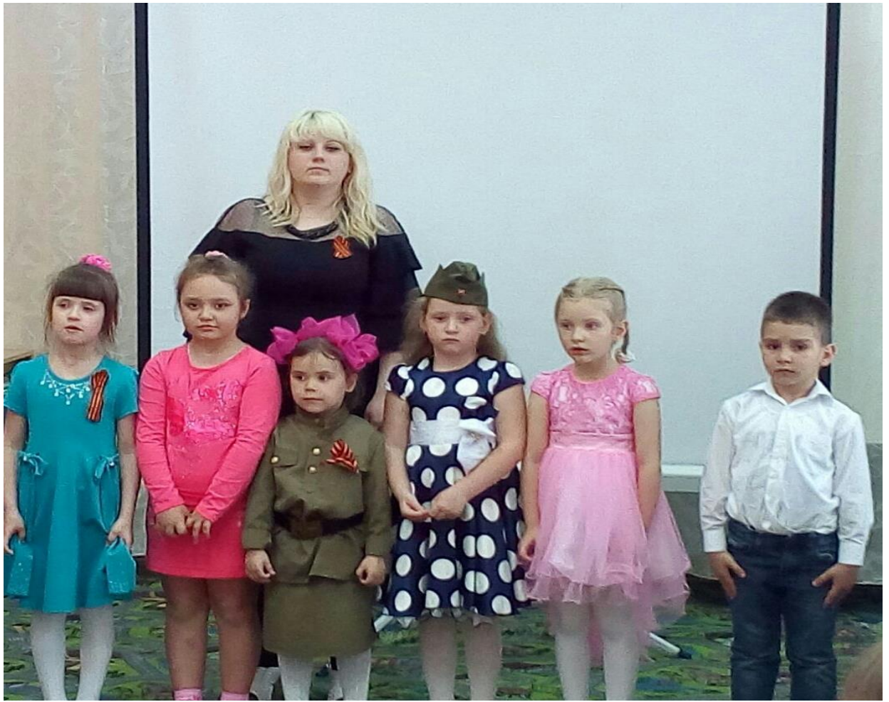
Исполнение патриотических песен